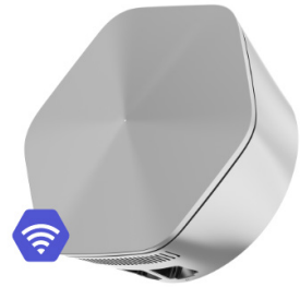
SuperPods Netzwerksteuerung per App